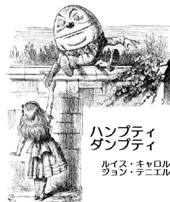
ハンプティ ダンブティ ルイジ:キヤロル