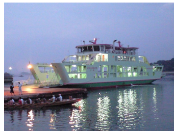
運行しているフェリー

フェリーの現状を紹介するとともに、利用者に実施したアンケート結果を用いてフェリーが存続していくための効率的な運航管理のあり方を模索していきます。