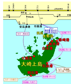
大崎上島のフェリー航路

日本は、多くの島々から構成されており、住民登録のある離島は約300島存在します。これらの島々の大半が過疎化、高齢化に悩まされており、広島商船高等専門学校が立地する大崎上島も同様の問題を抱えています。同島は、本土との連絡橋が未整備であり、通勤・通学など日常生活をフェリー交通のみに依存していますが、島民人口の減少はフェリー利用者減少に直結するため、交通サービス低下の弊害を受ける可能性も考えられます。