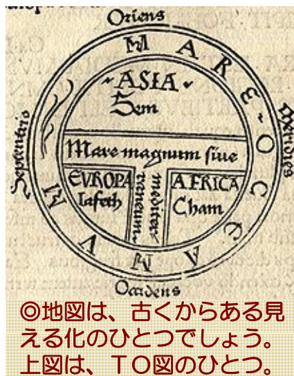
◎地図は、古くからある見える化のひとつでしょう。 上図は、T O図のひとつ。