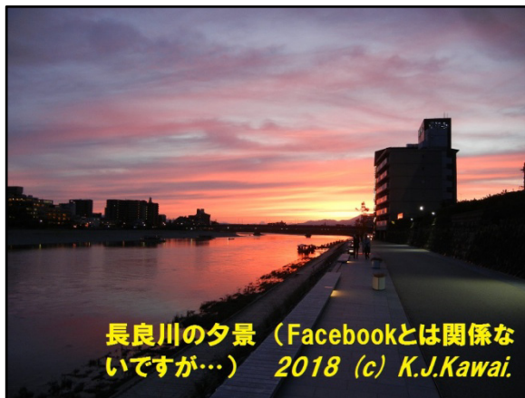
長良川の夕景 (Facebookとは関係ないですが…) 2018

SNS (ソーシャル・ネットワーキング・サービス) の「老舗」と言ってもよいでしょう。世界最大とされるSNS: Facebook (フェイスブック) をとりあげましょう。